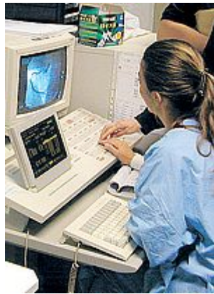
SCREENING Lotta alle malattie cardiovascolari

UN PROGETTO regionale per la prevenzione delle malattie cardiovascolari. Protagoniste la Casa della Salute di Copparo e Portomaggiore-Ostellato. L'obiettivo è di attivare uno screening con chiamata attiva, mediante l'utilizzo della carta del rischio e vari strumenti del progetto, per promuovere uno stile di vita salutare. L'iniziativa, rivolta a uomini entro i 45 anni e donne che non superino i 55, coinvolge in maniera gratuita 800 cittadini che saranno seguiti da